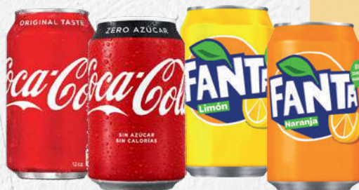
REFRESCOS Refrescos variats