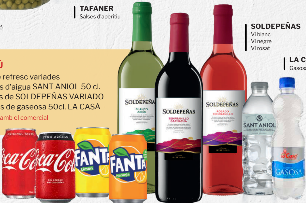
SOLDEPEÑAS Vi blanc Vi negre Vi rosat