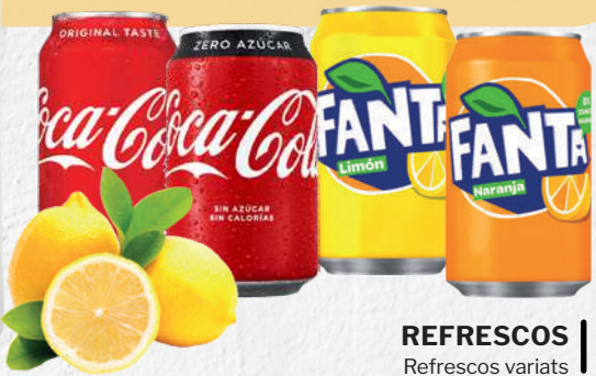
REFRESCOS Refrescos variats