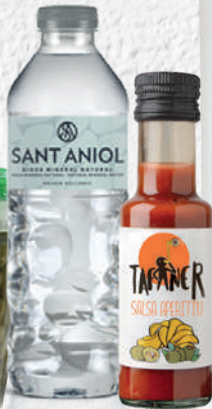
TAFANER Salses d'aperitiu