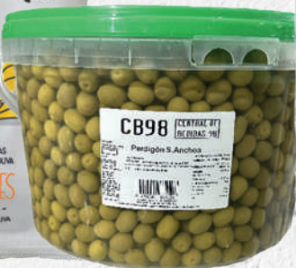
CB98 Olives perdigó