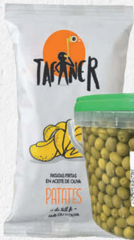
TAFANER Patates xips