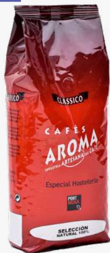
AROMA Caf  4 Kg.