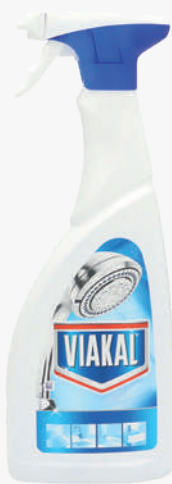
VIAKAL Netejador antical gel pistola 700 ml. *Consultar preu amb el comercial