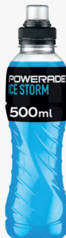
POWERADE Beguda energ tica 33 cl. PET.