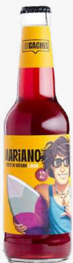
LOS CACHIS MARIANO "Tinto de verano" 33 cl. Vidre. S/R. 0'77€