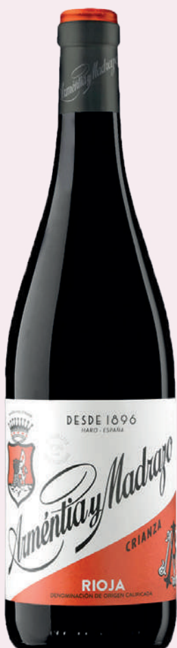
ARMENTIA & MADRAZO Vi negre criança D.O. Rioja 3'34€