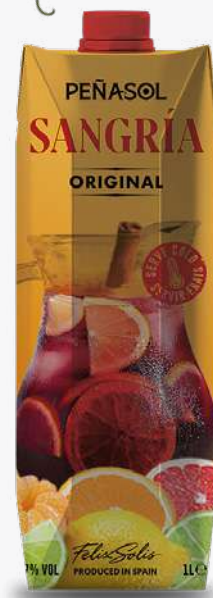
PEÑASOL Sangria 1 L. Prisma. 1'15€