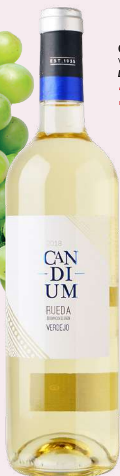
CANDIUM Vi verdejo D.O. Rueda 2'76€