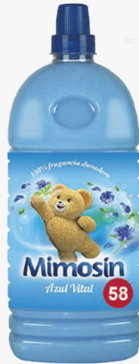
MIMOSÍN Suavitant roba blau 60D. *Consultar preu amb el comercial