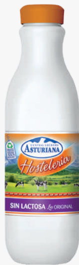
ASTURIANA Llet sense lactosa 1,5L.