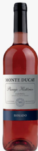
MONTE DUCAY Vi rosat 70 cl. 1'57€