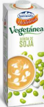
ASTURIANA Beguda soja 1L.