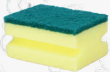
ESPONJA Fibra "salvaufias" 6 U. 3'11€