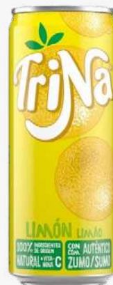
TRINA Llimona Llauna.