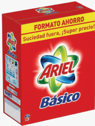
ARIEL Detergent roba pols bàsic 30D. *Consultar preu amb el comercial