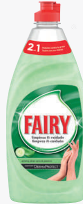
FAIRY Rentavaixelles manual aloe 400 ml. *Consultar preu amb el comercial