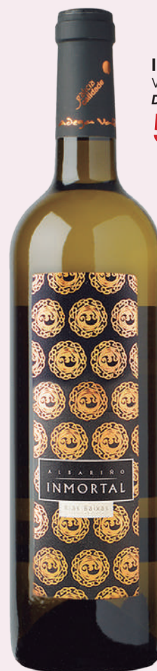
INMORTAL Vi albariño D.O. Rías Baixas 5'46€