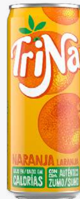
TRINA Taronja Llauna.