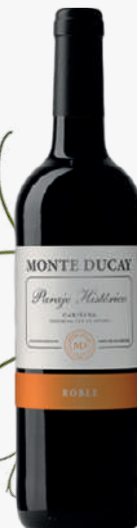
MONTE DUCAY Vi negre roure 70 cl. 1'66€