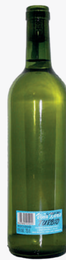
TURBIO XOVEN GALICIA Vi blanc tirilla 1'38€