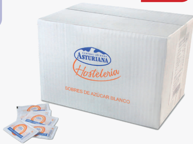
ASTURIANA Caixa de sobres de sucre