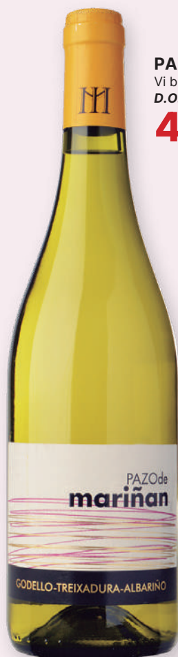
PAZO DE MARIÑAN Vi blanc godello coupage D.O. Monterrey 4'58€