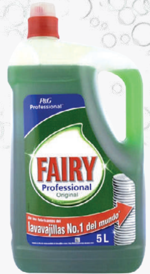
FAIRY Rentavaixelles manual professional 5 L. *Consultar preu amb el comercial