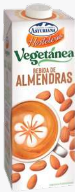
ASTURIANA Beguda ametlles 1L.