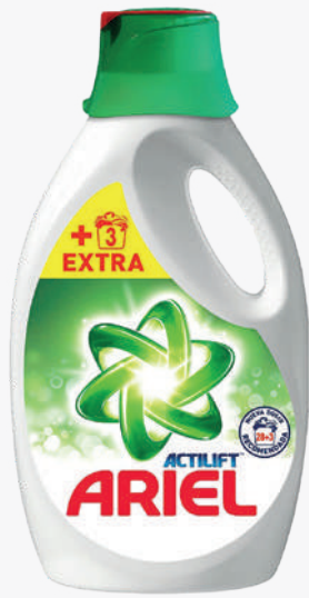
ARIEL Detergent roba neta líquid ULT.OXI 29D. *Consultar preu amb el comercial