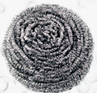
FREGALL Fregall acer inoxidable 40 gr. 12Px12U. 0'47€