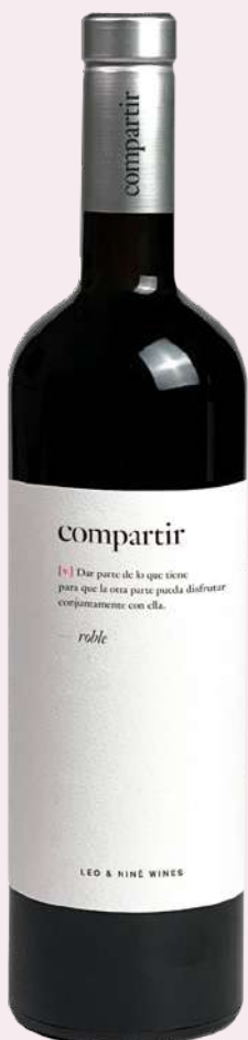
COMPARTIR Vi negre roure D.O. Somontano 4'44€