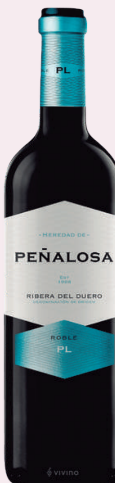
PEÑALOSA Vi negre roure D.O. Ribera del Duero 5'11€