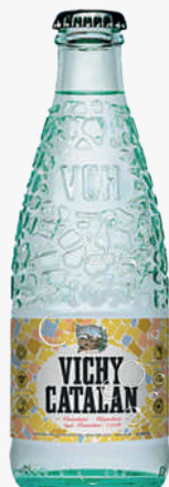
VICHY Aigua amb gas 33 cl. Vidre.