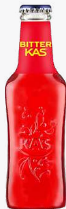
BITTER KAS Refresc 33 cl. Vidre.