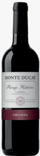
MONTE DUCAY Vi negre criança 1'87€