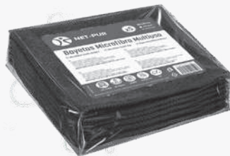
BAIETA Microfibres negra 35x38 5 U. 2'82€