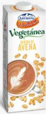
ASTURIANA Beguda civada 1L.