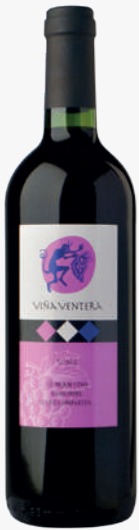
VIÑA VENTERA Vi negre 1'31€