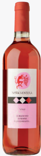
VIÑA VENTERA Vi rosat 1'31€