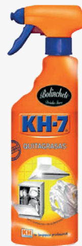
KH7 Desengreixant amb pistola 715 ml. *Consultar preu amb el comercial