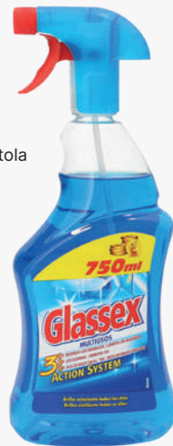
GLASSEX Multiusos 750 ml. *Consultar preu amb el comercial