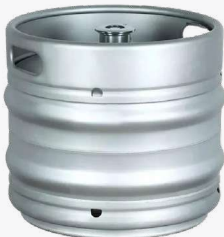
LOS CACHIS MARIANO o MARÍA "Tinto de verano" o sangria Format barril. *Consultar preu amb el comercial