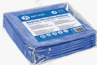
BAIETA Microfibres blava 35x38 5 U. 2'82€