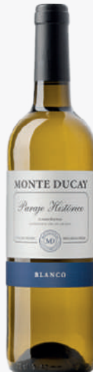
MONTE DUCAY Vi blanc 70 cl. 1'57€