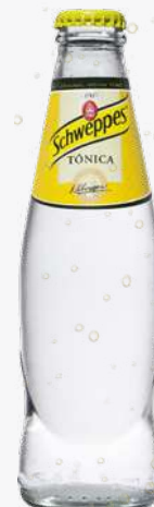
SCHWEPPE'S T nica 33 cl. Vidre.