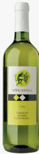
VIÑA VENTERA Vi blanc 1'31€