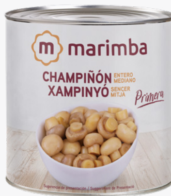
MARIMBA Xampinyons sencers 3 Kg. 6'81€