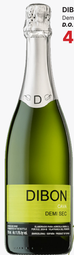
DIBON Demi Sec D.O. Cava 4'70€