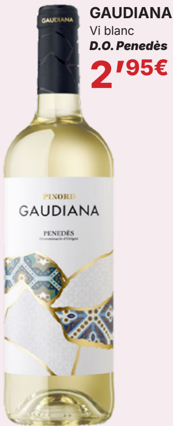
GAUDIANA Vi blanc D.O. Penedès 2'95€