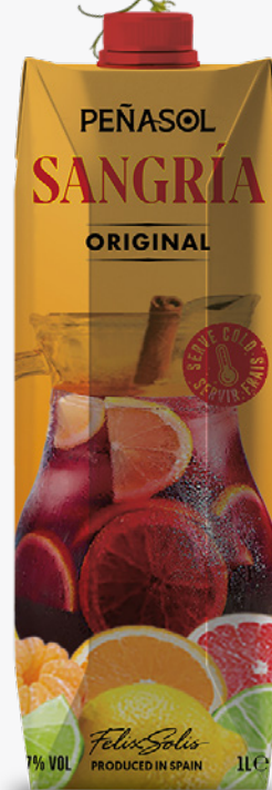
PEÑASOL Sangría 1L. BRICK. 1'15€