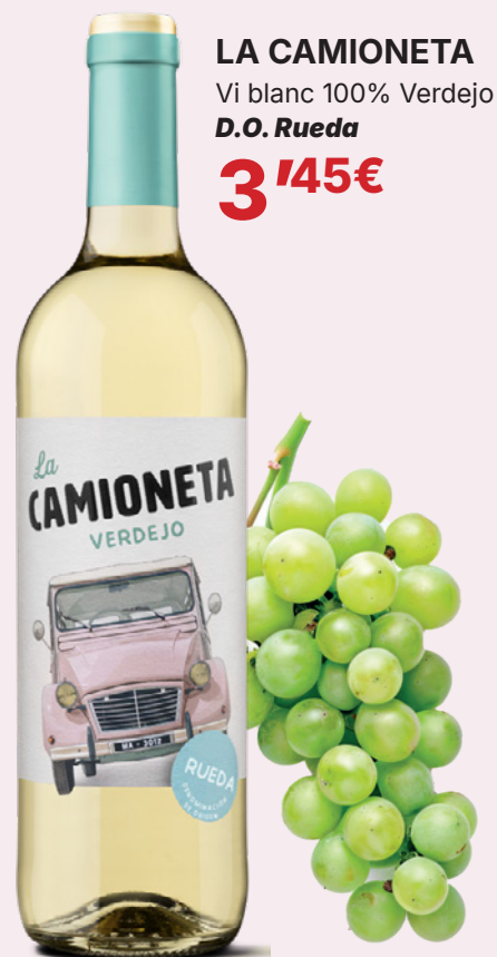
LA CAMIONETA Vi blanc 100% Verdejo D.O. Rueda 3'45€