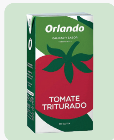
ORLANDO Tomàquet triturat 2 Kg. BRIK. 3'10€