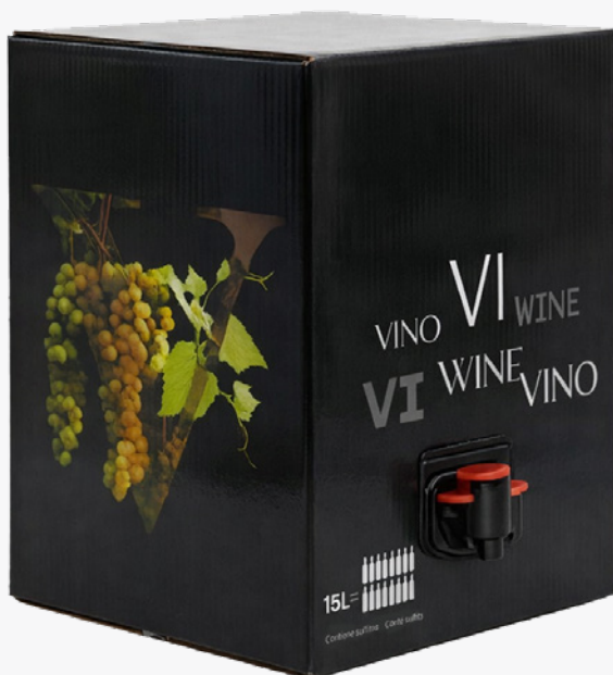
BAG IN BOX Vi blanc 15 L. 11° 18,21€ Vi negre 15 L. 11° 18,21€ Vi rosat 15 L. 12° 18,21€ Vi blanc 15 L. 14° 20,91€ Vi negre 15 L. 14° 20,91€