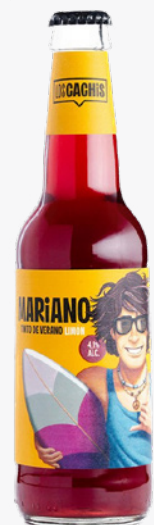
LOS CACHIS MARIANO Tinto de verano 33 cl. VIDRE. S/R 0'77€