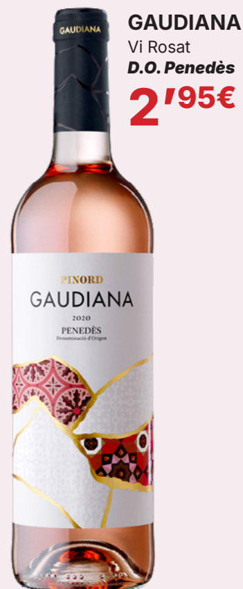
GAUDIANA Vi Rosat D.O. Penedès 2'95€