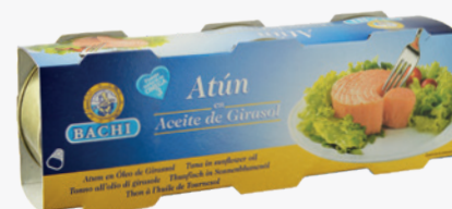
BACHI Tonyina en oli de girasol R085 PACK 3. LLAUNA. 2'76€