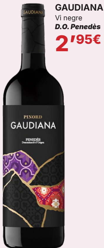
GAUDIANA Vi negre D.O. Penedès 2'95€