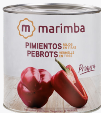
MARIMBA Pebrots en tires 3 Kg. 6'17€