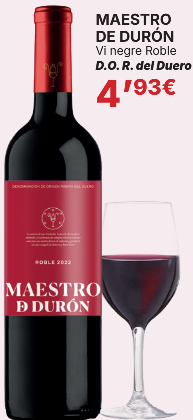
MAESTRO DE DURÓN Vi negre Roble D.O. R. del Duero 4'93€