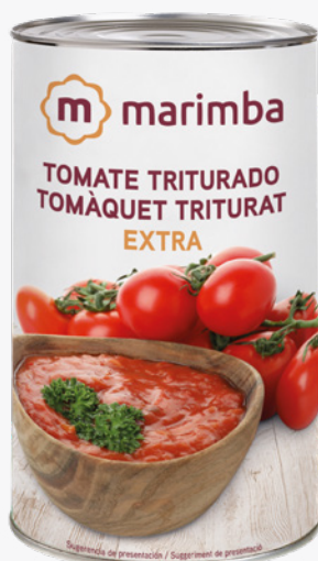
MARIMBA Tomàquet triturat 5 Kg. 4'40€