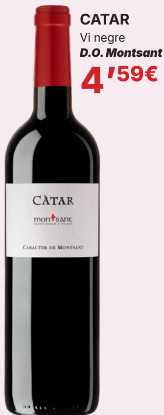
CATAR Vi negre D.O. Montsant 4'59€