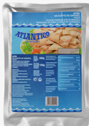
ATLÁNTICO Tonyina clara 1 Kg. BOSSA. 6'80€