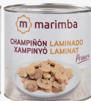
MARIMBA Xampinyons laminats 3 Kg. 5'13€