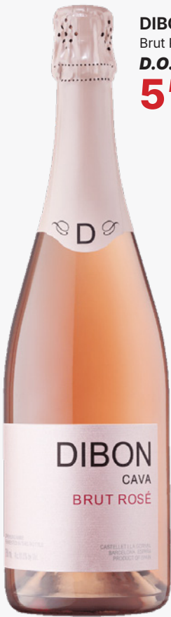
DIBON Brut Rosé D.O. Cava 5'16€