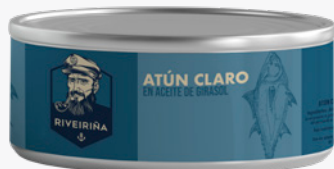
RIVEIRIÑA Tonyina clara R0900 LLAUNA. 6'54€