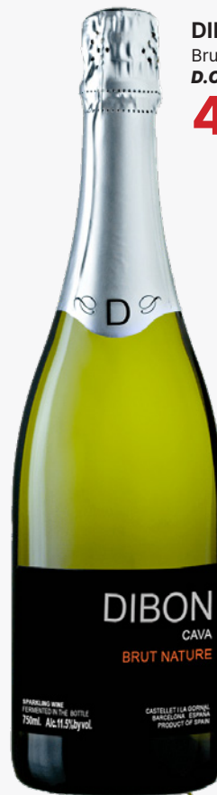
DIBON Brut Nature D.O. Cava 4'70€