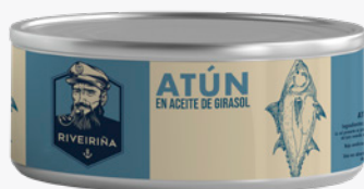
RIVEIRIÑA Tonyina en oli de girasol R0900 LLAUNA. 6'34€