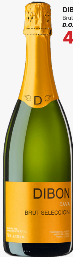
DIBON Brut Selección D.O. Cava 4'70€