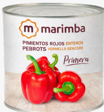
MARIMBA Pebrots sencers 3 Kg. 5'97€