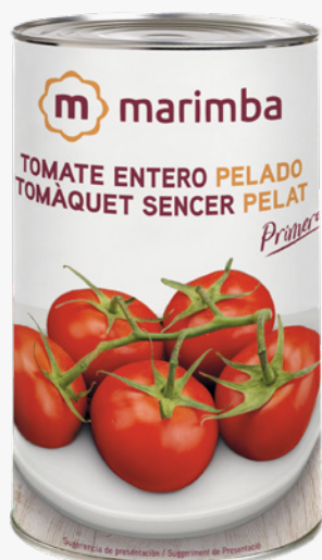
MARIMBA Tomàquet sencer pelat 5 Kg. 5'15€