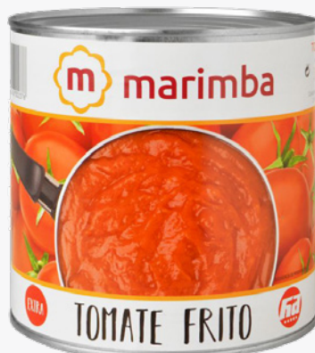
MARIMBA Tomàquet fregit 3 Kg. 2'88€